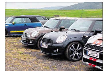
Die Minis kommen – erneut nach Süttenbach.

LINDLAR/WIPPERFÜRTH. Noch einmal eine Steigerung erwarten die „Mini Freunde NRW“ für ihr drittes großes Treffen, diesmal in Süttenbach. 400 bis 500 Autos der Marke Mini aller Baujahre werden ab Freitag, 26. Juni, erwartet, dazu kommen 20 Aussteller. Die Autos kommen nicht nur aus NRW, Mini-Freunde aus den Benelux-Staaten, der Schweiz und Österreich sind dabei. Ein Rennteam präsentiert Fahrzeuge, ebenso ein Rallye Team. Für den guten Zweck werden am Haupttag, am Samstag, 27. Juni, gegen 17 Uhr zwei besonders gestaltete Bobby Cars versteigert, auf „amerikanische Art“, so Torsten Laufberg vom Veranstalterteam. Der Erlös wird der Kinderkrebshilfe Düsseldorf übergeben. Das Treffen soll künftig das größte private Mini-Treffen werden, hoffen die Veranstalter. tf