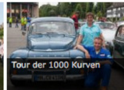
Tour der 1000 Kurven