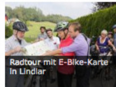
Radtour mit E-Bike-Karte in Lindlar