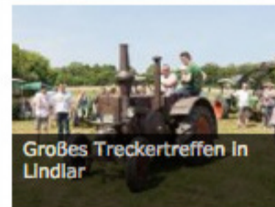
Großes Treckertreffen in Lindlar