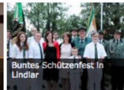
Buntes Schützenfest in Lindlar