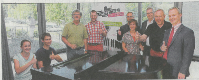
Die Vorfreude ist groß, der Arbeitsaufwand auch: Am Klavierfestival Lindlar wirken viele Organisatoren mit.